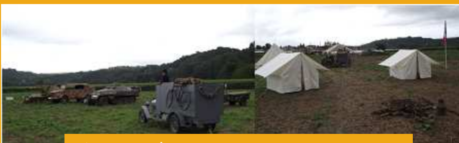
Le bivouac en août 2012 ...

A noter, cette année, le partenariat des états majors de l'armée de terre et de l'armée de l'air pour l'animation de cette manifestation.