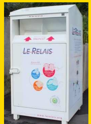
Conteneur à votre disposition Place Camille Landes