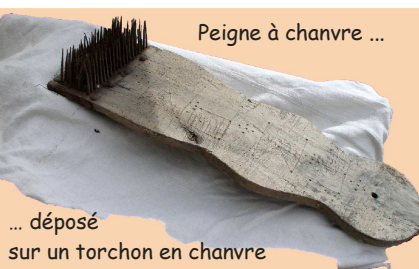
... déposé sur un torchon en chanvre

Les fibres ainsi libérées, sont battues une deuxième fois pour éliminer les derniers résidus ligneux. Après ces opérations, la fibre peut enfin être peignée, filée (filasse) et tissée.