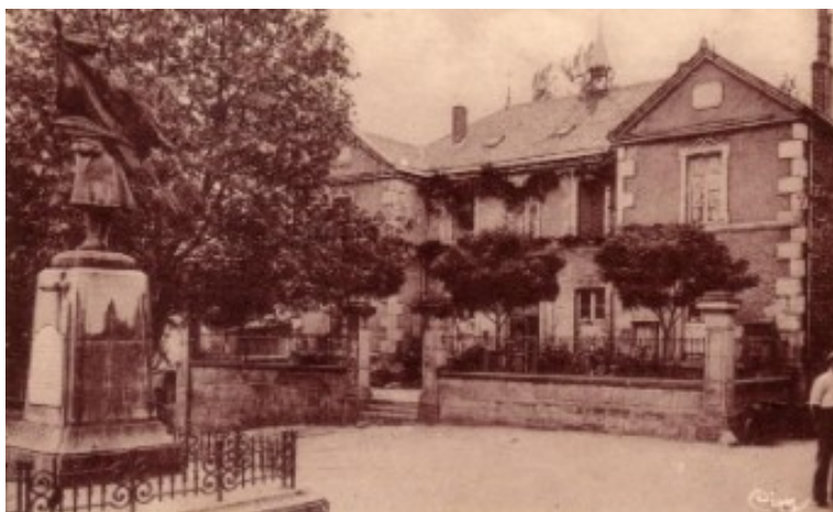
Carte postale de la place avant 1953 (Cournède)

Conjointement à ce vaste chantier, l'établissement d'un réseau d'égout et des TRAVAUX d'URBANISME s'avèrent nécessaires : le nivellement de l'ancienne place est réalisé, l'antique croix et le monument aux morts déplacés. On trouve les fonds en tirant bien des sonnettes et avec le concours des Houillères et Vieille Montagne, toutes deux propriétaires sur la commune. On demande à un architecte d'Ales, M. IGOU , de dresser les plans, et on se met au travail après l'adjudication du 21 février 1951.