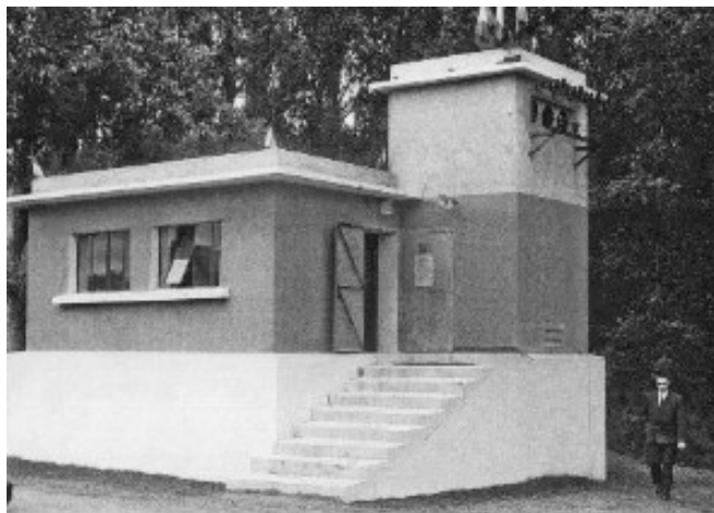
La station de pompage

DISTRIBUTION : L'eau est distribuée dans l'agglomération et s'étend aux villages isolés ainsi qu'à Penchot et Laroque-Bouillac.