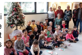
Les enfants et les bénévoles

Comme chaque année, les bénévoles de la médiathèque ont eu à cœur de proposer aux enfants un après-midi autour de Noël. A la trentaine d'enfants du Centre de loisirs présents ce jour-là, quelques enfants du village accompagnés de leurs parents se sont joints au groupe. C'est dans la bonne humeur générale que tous ont participé aux différents ateliers. Avec au programme : chants et réalisation de plusieurs travaux manuels que les enfants ont pu emporter chez eux. Et pour finir : un bon goûter offert par l'association Olt'his.