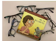
Titre : « Moi, j'ai des lunettes »