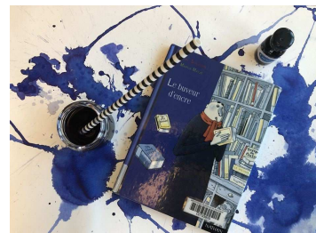
Titre : « Le buveur d'encre »

Collectif sélection des artistes et équipe d'animation de la médiathèque