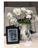
Titre : « Changer l'eau des fleurs »